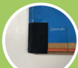
Lloms reforçats amb cinta